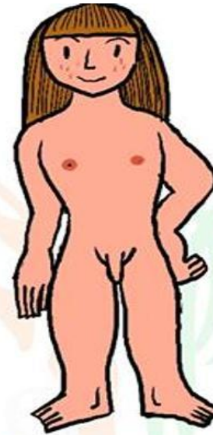
...y chicas con pene