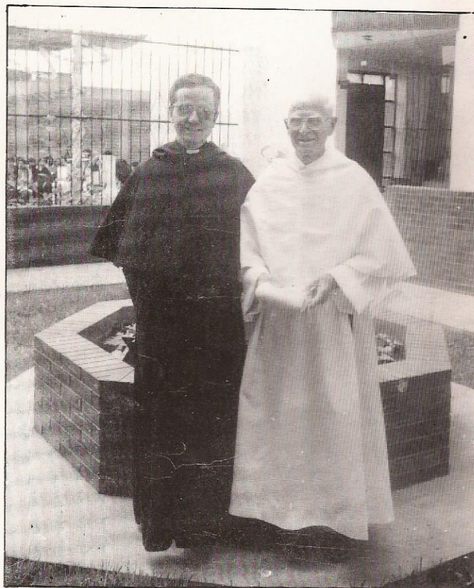
Con el P. General celebrando sus 60 años de sacerdocio

Al poco tiempo salió para Cuba, a la parroquia de "Cristo del Buen Camino", distinguiéndose por su piedad y amor a los pobres durante 29 años. Cuando irrumpió la Revolución, logró quedarse, sufrió mucho: detenciones, intento de fusilamiento y toda clase de vejámenes. En 1968, con permiso del gobierno partió a los EEUU, para visitar a su provincia, pero una vez fuera, el gobierno no permitió su retorno.