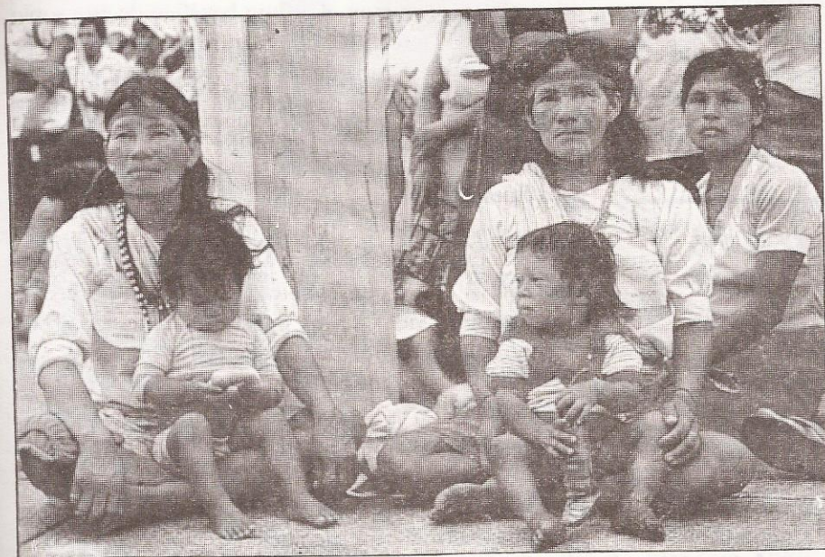
Los indígenas no han sido promocionados

campesinado, eran algunas de las evidencias más patéticas. La Iglesia de América Latina, tradicionalmente ligada a los poderes y anclada en una espiritualidad retórica, se veía empujada a dar el salto e iniciar la gran aventura de asumir su mundo específico con sus dolores y esperanzas, y volver a lo nuclear del Evangelio, es decir a la humanización plena del hombre en Cristo.