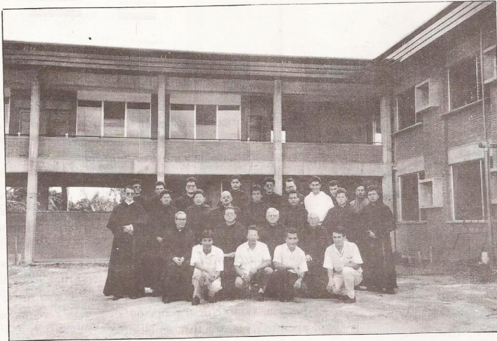
Los hermanos de la Circunscripción de Ntra. Sra. de la Paz, y sus ilustres visitantes, en el día de la Bendición de la Casa de Formación "San Agustín de San José de Costa Rica".

E n medio de un istmo centroamericano que se debate constantemente entre el diálogo y el conflicto, entre la vida y la muerte, existen claras señales que nos llevan a ser optimistas ante el futuro que se avecina.