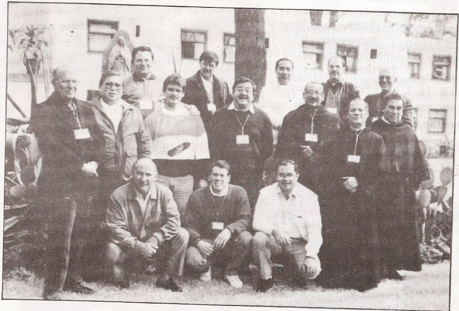
Participantes del Encuentro de Párrocos Urbanos